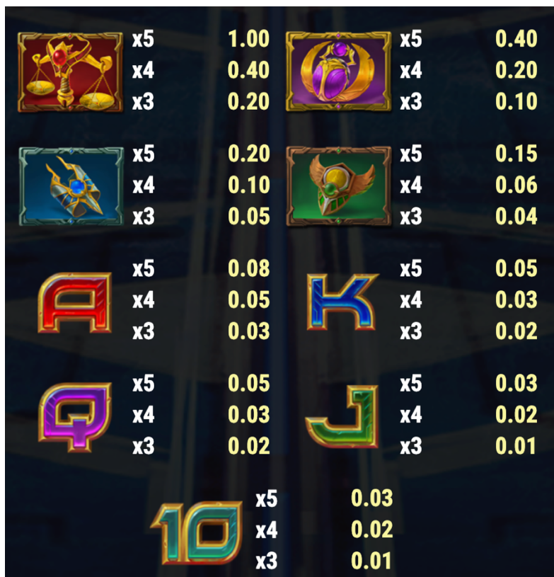
Izmaksu Veidu Tabula